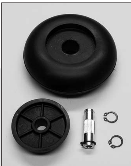
Demontiert: Entgegen manch anderer Reifen lassen sich jene von FEMA im Notfall demontieren

Um den Einsatz der Räder nun auch dem Motorflug-Piloten zu ermöglichen, bietet FEMA zu seinen Rädern passende Steckachsen an. Fahrwerkseitig mit ei-