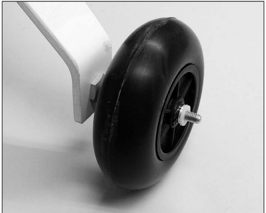
Die Montage der Steckachse am GfK-Bügel mit maximal 6 mm Stärke wird zum Selbstgänger