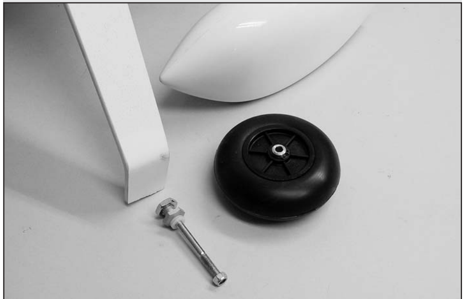
Hier liegt noch getrennt, was eigentlich zusammengehört

FEMA-Modelltechnik, Obere Rebbegstr. 11, 77709 Wolfach, Tel. 07834/303 oder www.FemaModelltechnik.de